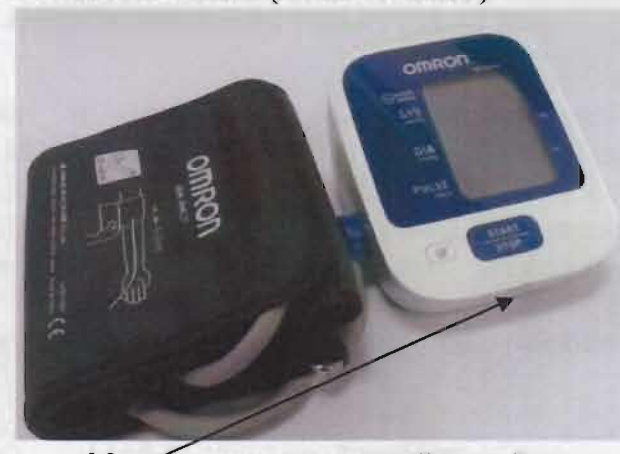
Место нанесения защитной наклейки.

Рисунок 3 – Измеритель артериального давления и частоты пульса автоматический OMRON M2 Basic (HEM-7121-ARU).