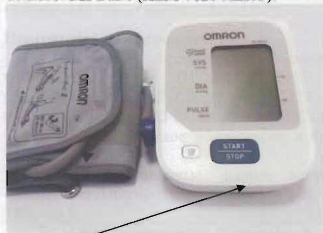
Место нанесения защитной наклейки.

Рисунок 2 – Измеритель артериального давления и частоты пульса автоматический OMRON M2 Basic (HEM-7121-RU).