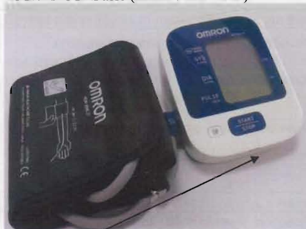
Место нанесения защитной наклейки.

Рисунок 4 – Измеритель артериального давления и частоты пульса автоматический OMRON M2 Classic (HEM-7122-ALRU).