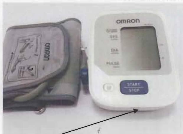
Место нанесения защитной наклейки.

Рисунок 1 – Измеритель артериального давления и частоты пульса автоматический OMRON M2 Basic (HEM-7121-ALRU).