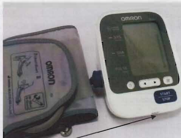
Место нанесения защитной наклейки.

Рисунок 5 – Измеритель артериального давления и частоты пульса автоматический OMRON M2 Classic (HEM-7122-LRU).