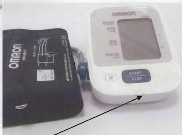
Место нанесения защитной наклейки.

Рисунок 1 – Измеритель артериального давления и частоты пульса автоматический OMRON M2 Basic (HEM-7121-ALRU).