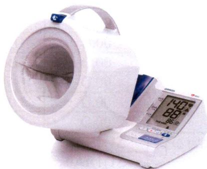
Рисунок 4 – Общий вид ИАД с автоматическим поддержанием скорости снижения давления в манжете (исполнение I-Q132)