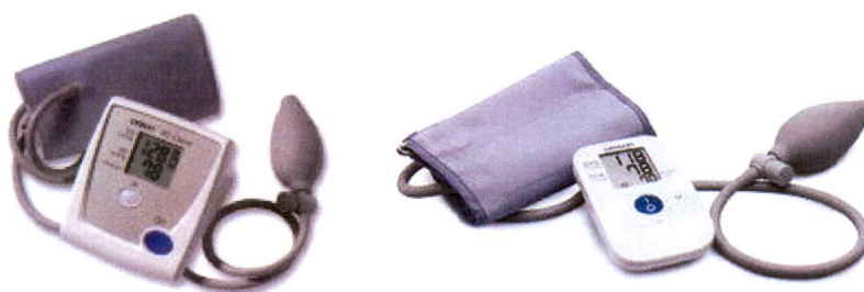
Рисунок 2 – Общий вид ИАД полуавтоматических, для измерений на плече