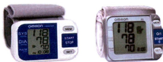
Рисунок 3 – Общий вид ИАД автоматических, для измерений на запястье