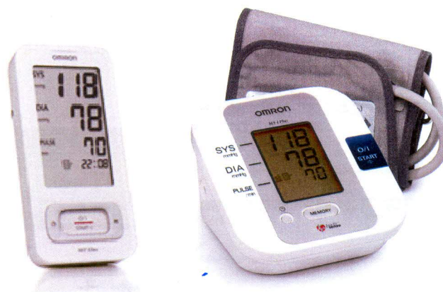
Рисунок 1 – Общий вид ИАД автоматических, для измерений на плече

Общая схема пломбировки и маркировки – на рисунке 5.